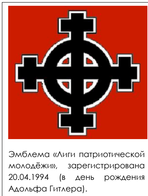
Эмблема «Лиги патриотической молодёжи», зарегистрирована 20.04.1994 (в день рождения Адольфа Гитлера).