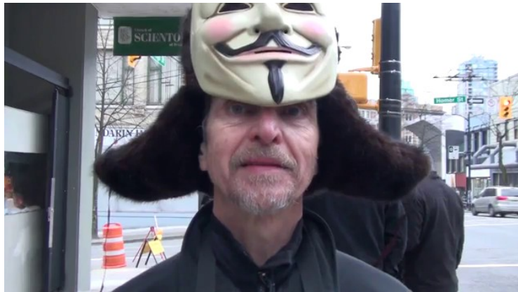
В Гамбурге, 2009