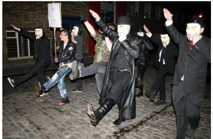
Члены движения Анонимус маршируют в Лондоне, 2009