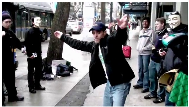
Армстронг танцует для членов движения Anonymous, 2010